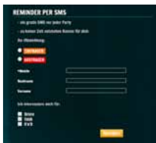
Anmeldung auf Webseite