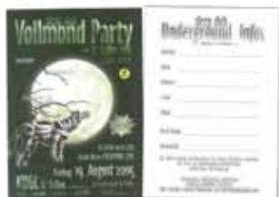
Anmeldung per Flyer